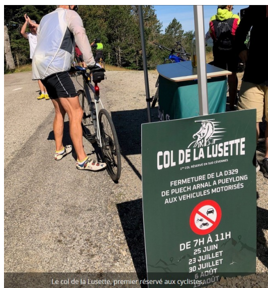
Le col de la Lusette, premier réservé aux cyclistes

Comment le vélo peut-il réenchanter notre territoire ?