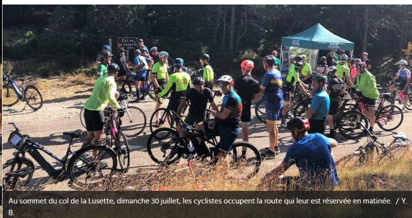
Au sommet du col de la Lusette, dimanche 30 juillet, les cyclistes occupent la route qui leur est réservée en matinée. / Y. B.